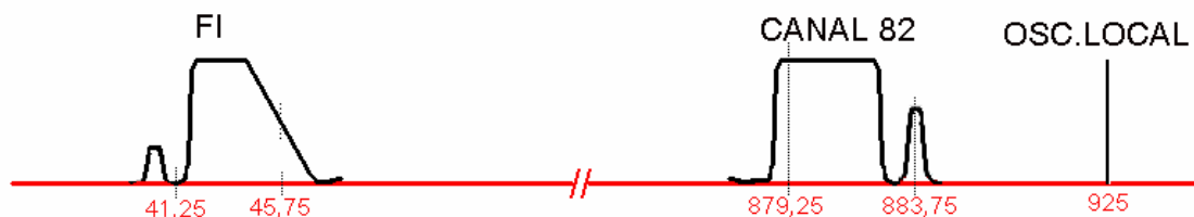
Fig.1 Plan de frecuencia canal 82 de UHF

En la figura 7.3.1 indicamos el plan de frecuencias para el canal de UHF 82 de la norma M (América). Para este canal el oscilador local debe estar en una frecuencia de 925 MHz.